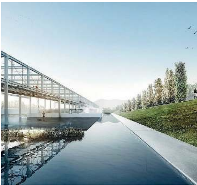
Come dovrebbe essere. Una resa grafica del maxi depuratore

I primi cittadini coinvolti commissionano a esperti uno studio del progetto e di possibili variazioni