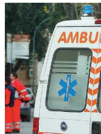
In campo. Un'ambulanza

La vittima dell'incidente avvenuto ieri mattina intorno alle 9.30 lungo via XXV Aprile,