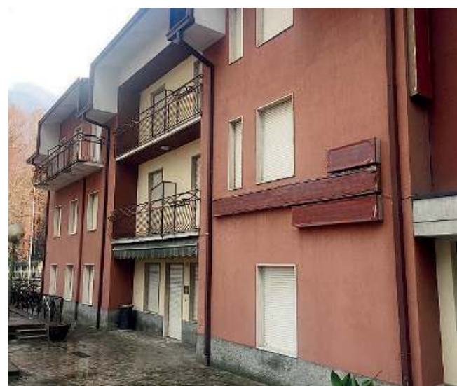
Chiuso negli anni Novanta. L'ex hotel Ariston di Boario

Gli hotel Ariston, Ornella e Miravalli ospiteranno attività commerciali e strutture abitative