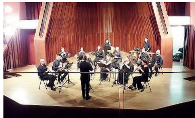
Orchestra. Uno scatto dell'edizione dello scorso anno