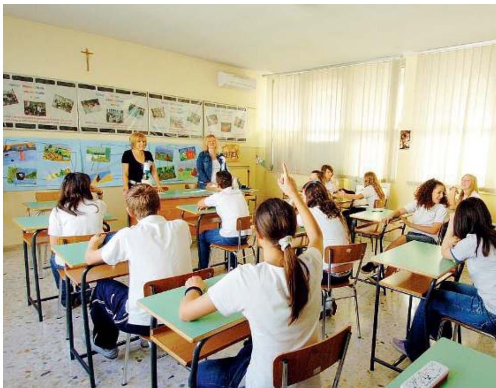
Partecipazione. Il progetto vuole coinvolgere anche gli studenti meno motivati

Concesio, giochi da tavolo. Giovedì in biblioteca dalle 15.30 alle 18 torna «Game zone», giochi da tavolo per bambini e famiglie. La partecipazione è gratuita.