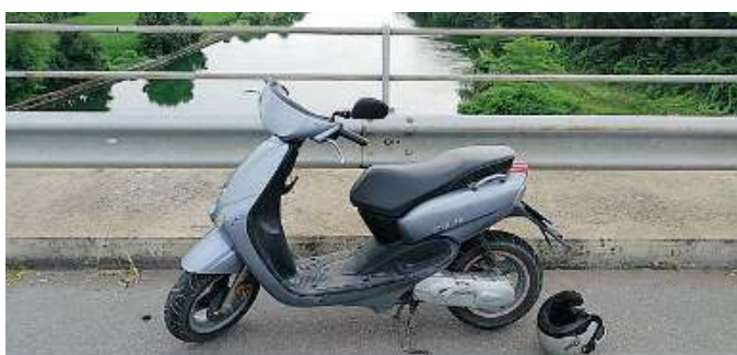
Lo scooter. Il mezzo dell'uomo abbandonato sul ponte prima del lancio

L'uomo è arrivato sul posto guidando il proprio scooter, ha accostato e ha lasciato il motorino incustodito e il casco a terra. Dopodiché ha scavalcato la ringhiera che separa (troppo facilmente) il marciapiede dal fiume e si è lanciato nel vuoto, con ogni probabilità nel tentativo di compiere l'estremo gesto. Ad assistere alla scena c'erano però diversi automobilisti e un gruppo di pescatori, che hanno osservato la scena dalle rive del fiume e hanno