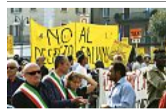
Insieme Sindaci e migranti