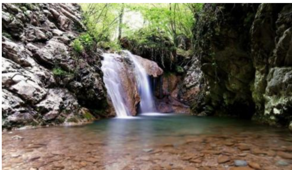
Una delle tante cascate che caratterizzano uno dei percorsi più spettacolari della Franciacorta

Intanto sono già aperte e vanno a gonfie vele le iscrizioni (il termine è fissato per il 1 settembre o fino a esaurimento dei posti disponibili) alla nona edizione della «Magnalonga» che si svolgerà dome-