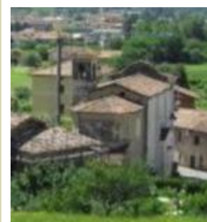
La chiesa di San Lorenzo

La compagnia Olga in scena a San Lorenzo