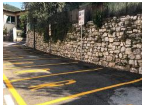
Il parcheggio prima del sentiero per i residenti

nica 9 settembre. Il percorso enogastronomico attraverso le strade, i sentieri e le frazioni di Monticelli Brusati consiste in una passeggiata di 12 chilometri da percorrere a piedi con la bellezza di 6 punti ristoro. In ognuno dei quali verrà servito un piatto tipico, accompagnato dal vino di alcune delle migliori cantine della zona (La Montina, Antica Fratta, Cantine Manessi, Villa, Castelveder, Cà dei Colli, Ciapel, Angelo Boniotti e Ravarini).