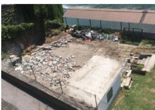
La vecchia sede del Kccp demolita per far posto alla nuova

Lo spazio declinerà dolcemente fino al piano protetto dalla tettoia del secolare lavatoio. Sul prato saranno creati percorsi e passerelle che garantiranno in sicurezza l'accesso ai diversamente abili. I sentieri con pavimentazione in teak e faretto segnapassi porteranno a due accessi al fiume, con una rampa sul tratto più comodo per l'imbarco, dotata di un'area-deposito per sedie a rotelle, e una più diretta dallo spiazzo tra uffici e spogliatoi e rimessaggio di kayak e canoe.