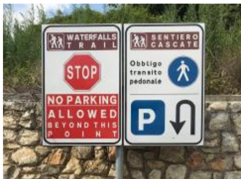
Uno dei nuovi cartelli posizionati in paese