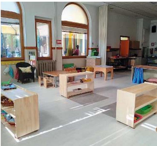
A misura di bambino. L'interno della scuola materna