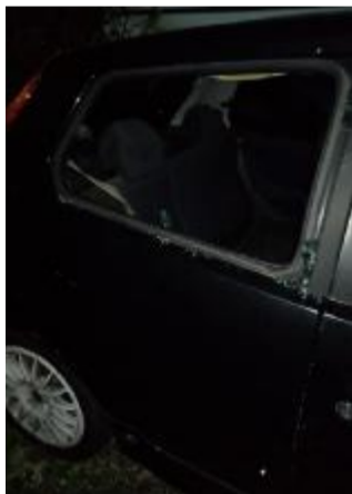
Numerosi i cristalli infranti

somma alle stelle dopo l'escalation di blitz avvenuti anche nell'arco di poche ore. Le prime avvisaglie in realtà si erano avute una settimana fa, quando erano andati in frantumi i vetri di alcune auto parcheggiate in via Mainone, a Faidana.