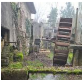
Il Maglio di Nuvoletto

Domani sarà la volta del Maglio, in vicolo Fucine: a partire dalle 11, ventitré coltellinai provenienti da tutto il nord Italia esporranno i loro manufatti; nel pomeriggio si potrà assistere alla forgiatura di lame battute a mano. Saranno presenti durante tutta la giornata i birrifici artigianali bresciani: La Martina, Emod Brewery e Birrifico Artigianale Curtense. Alle 16, sem-