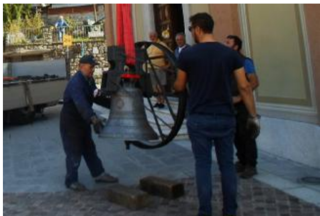
Le tre campane storiche «Cavadini» risalgono addirittura al 1906