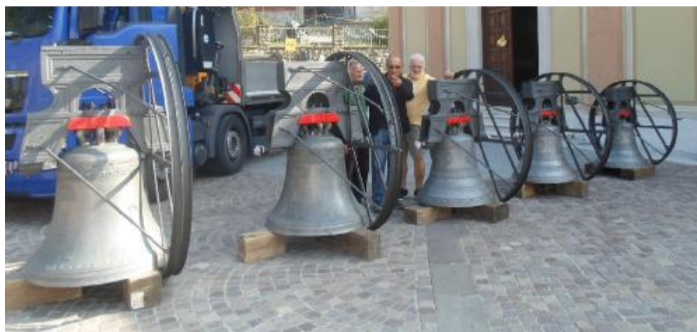
I cinque bronzi della parrocchiale sono tornati a casa ieri: lunedì torneranno sulla torre campanaria

Il rischio di cedimenti e i danni provocati dall'usura avevano costretto la parrocchia a dare il via ai lavori. Lunedì saranno ricollocate all'interno della loro cella